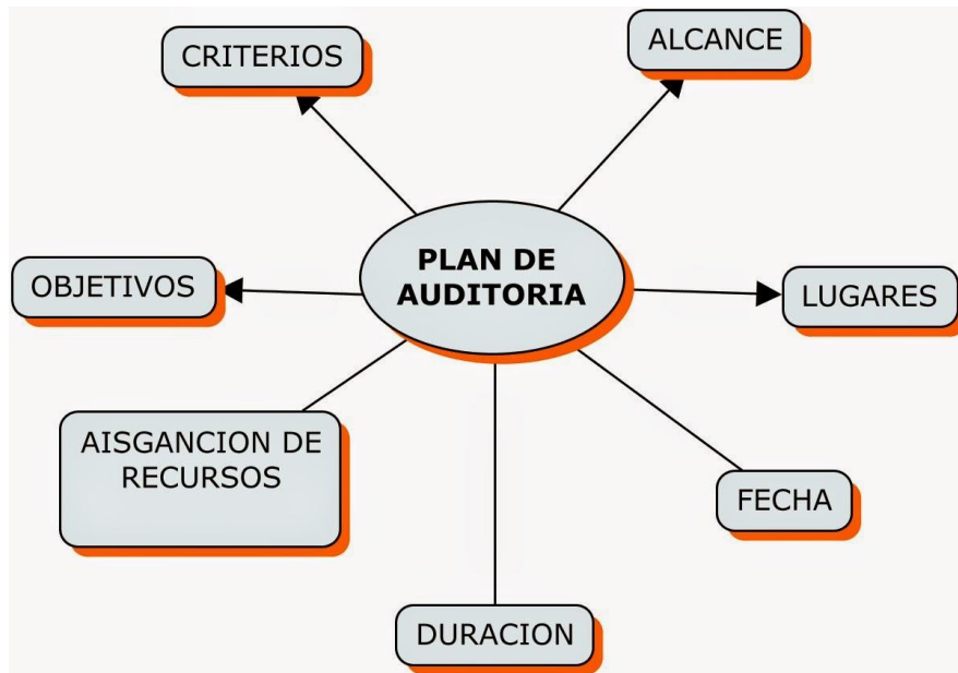
Figura 4: Esquema general de la realización de auditorías.

Adicionalmente, los proyectos que realizan las mepresas del Grupo Empresarial, están sujetas a auditorías por parte de Interventores, quienes de manera independiente auditan el cumplimiento de los requisitos legales, normas y otros. En la figura 4, se presenta el esquema generalizado para el desarrollo de las auditorías al Sistema de Gestión Integrado, SGI.