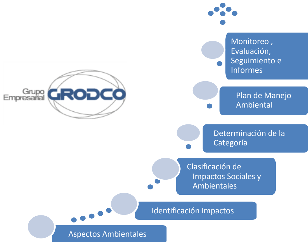
Figura 3: Evaluación Socio – Ambiental de proyectos del Grupo Empresarial Grodco.

En la figura 3, se presenta el procedimiento de cómo se evalúa los componentes sociales, ambientales y culturales de los proyectos.