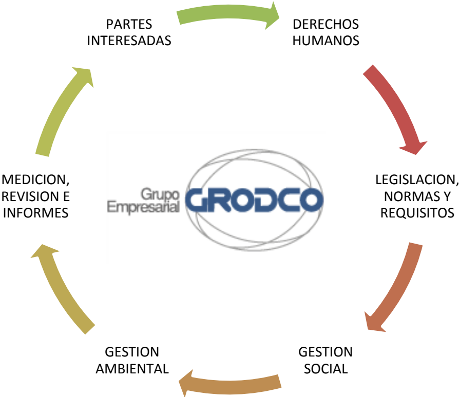
Figura 1: Planeación y Adopción de los Principios de Ecuador en el Grupo Empresarial Grodco

En la Figura 1, se presenta la forma como el GRUPO EMPRESARIAL GRODCO, adopta de manera general los Principios de Ecuador.